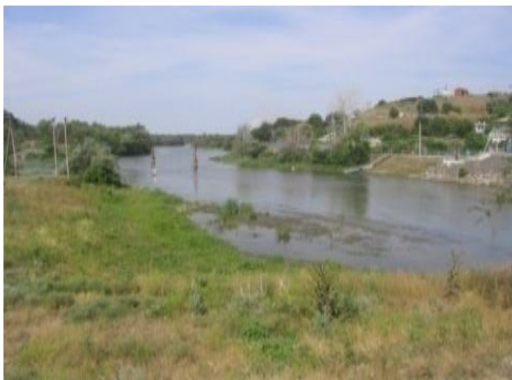
Рисунок 3 – Рыбозаградитель и сороудерживающая запань

Ковшевой бесплотинный водозабор ГРЭС расположен на 6 км ниже по течению от станицы Мелиховской – на правом берегу р. Дон в районе большой излучины. Ковш водозабора разработан земснарядами. Рыбозаградитель и сороудерживающая запань находятся в стадии реконструкции (рисунок 3). При варианте размещения рыбозащитного сооружения в непосредственной близости от ГРЭС вся акватория подводящего канала может использоваться в целях рыбозаведения.