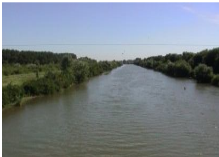
Рисунок 2 – Сбросной канал № 2 (теплый канал)

Новочеркасская ГРЭС представляет собой сложный водохозяйственный комплекс, который осуществляет пользование водными объектами с целью подачи воды для охлаждения основного оборудования с последующим сбросом подогретой воды. ГРЭС имеет в своем составе не только энергетические объекты, но и размещенную на большой территории систему гидротехнических сооружений, включающих водозабор, подводящий и отводящие каналы (рисунок 2), сифонный водосброс, дюкер, насосные станции и другие сооружения.