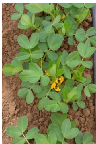
Рисунок 1 – Цветение арахиса Figure 1 – Peanut blossom

Арахис культурный ( Arachis hypogaea L.), или земляной орех, – однолетнее растение из семейства бобовых Fabaceae Lindl, рода Arachis L. (рисунок 1). Арахис – ценный предшественник для многих сельхозкультур. Арахис накапливает большое количество органического вещества, оказывая положительное влияние на почвенное плодородие. Поэтому выращивание арахиса необходимо включать в севооборот.